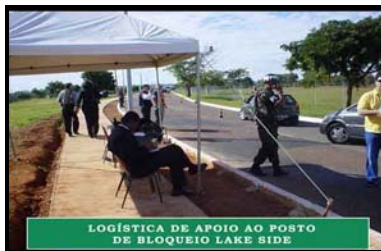
LOGÍSTICA DE APOIO AO POSTO DE BLOQUEIO LAKE SIDE