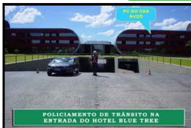
POLICIAMENTO DE TRÂNSITO NA ENTRADA DO HOTEL BLUE TREE