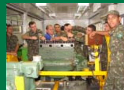
Batalhão realiza Programa Soldado Cidadão e leva ensino profissionalizante aos seus militares

Parabéns ao Guerreiro Pantaneiro pelo seus 34 anos.