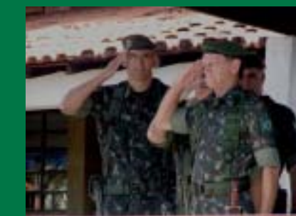
Guerreiro Pantaneiro recebe visita do Comandante Militar do Oeste