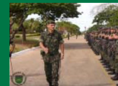
Batalhão recebe visita do novo Comandante da 13ª Bda Inf Mtz