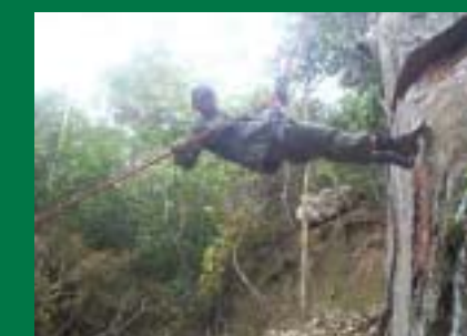
47º BI Realiza Estágio Básico de Combatente de Força de Ação Rápida (EBCFAR/2010)